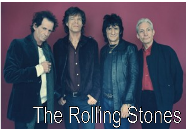
The Rolling Stones

В 2000-ных новых музыкальных стилей, как токовых, не появлялось, практически, вообще. Появился поджанр панка – эмо-рок, но скорее всего, как исчезнет молодежная субкультура эмо, исчезнет и потребность в этом музыкальном стиле.