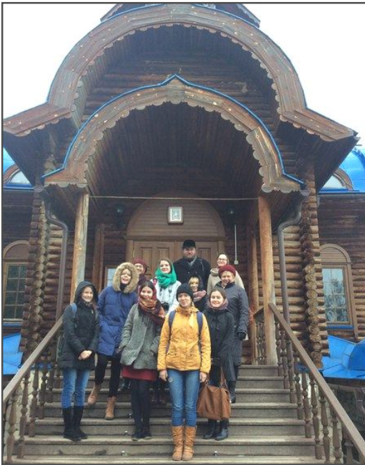
Экскурсия в Свято-Воскресенский мужской монастырь