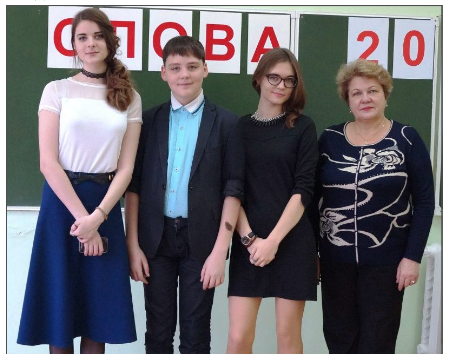
На конкурсе ораторского искусства «Мастер слова»