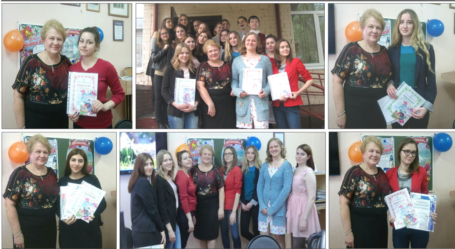
Коллаж: Алина КОСТЮКОВА