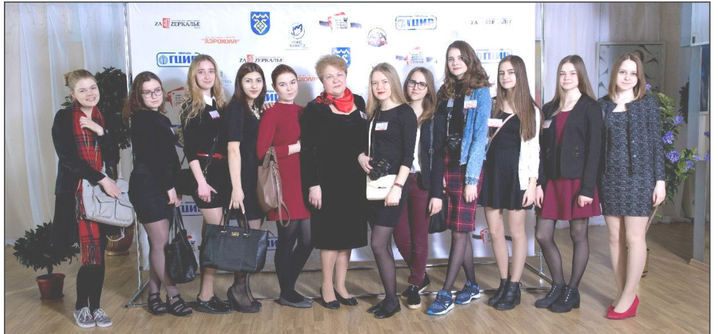
На фестивале экранных искусств «ZerKalye»