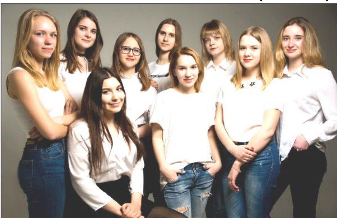
Фотография для журнала «Дети в малине»